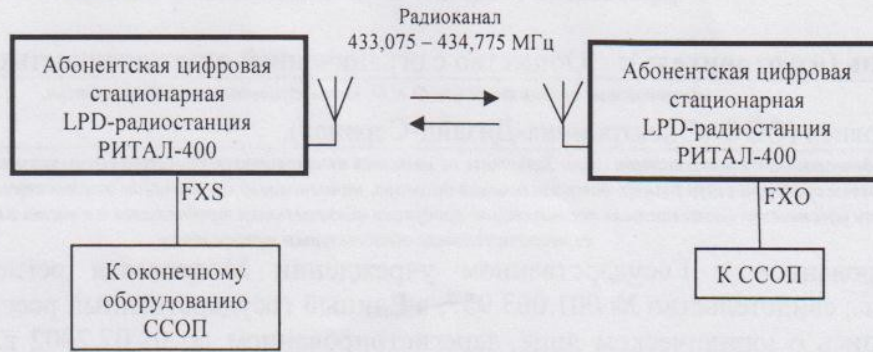
Схема подключения к ССОП:

Характеристики радиоизлучения: вид модуляции – QPSK.